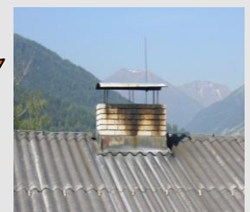
Folgeschäden innerhalb und außerhalb des Kamins